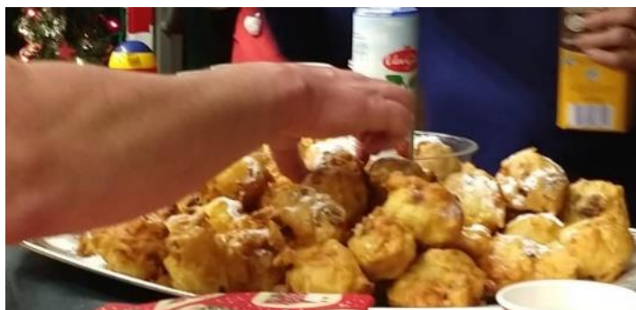
Pepermunt en Jaap bollen