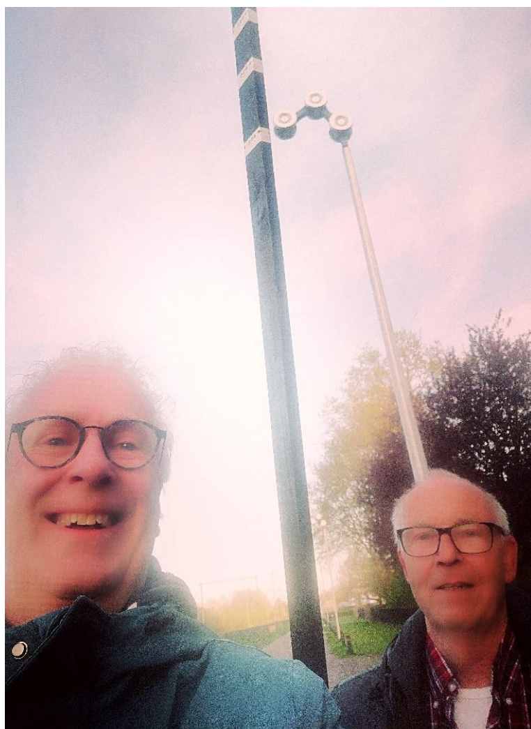
De heren meten hier een lantaarnpaal op