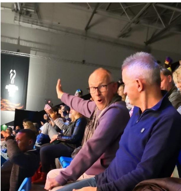
Ronald weet het weer eens beter dan de scheids

Voor iedereen die er niet bij was: gemiste kans, voor de deelnemers: hik.