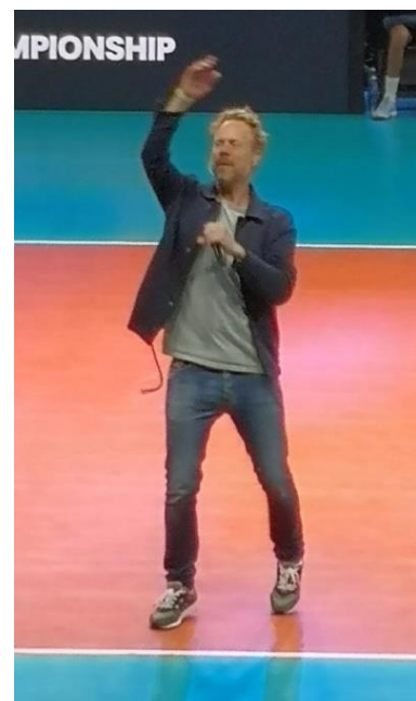
in de pauze optreden van bekende Nederlander